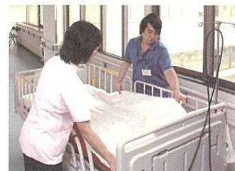
医大病院で就労するスタッフ(右)