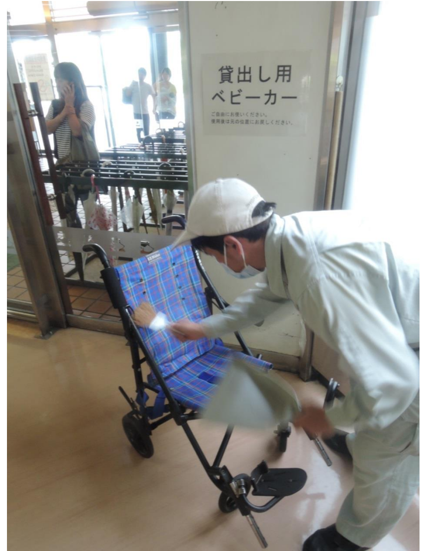
ベビーカーの清掃業務