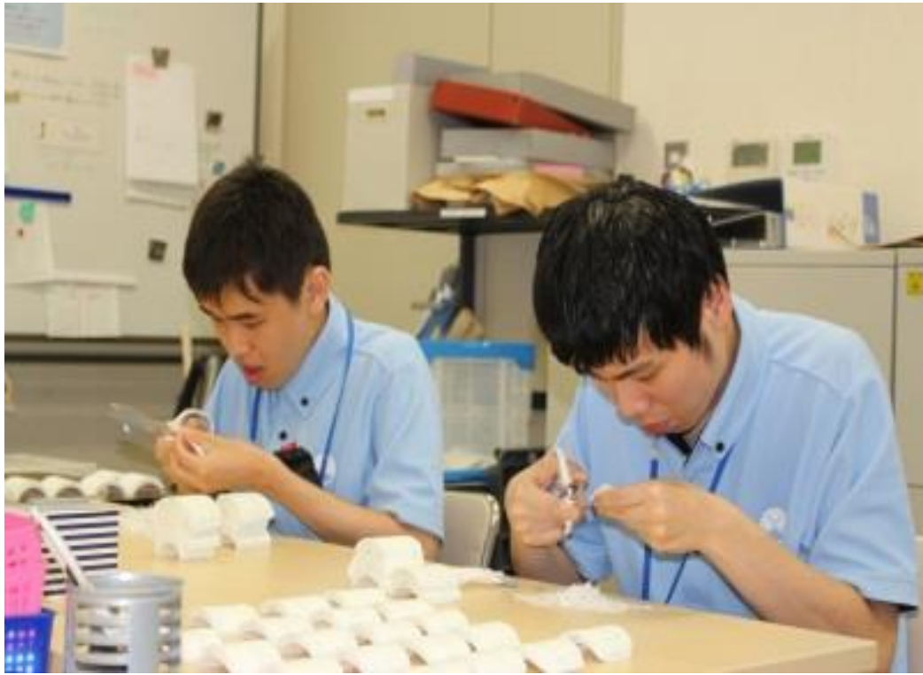
テープカット業務