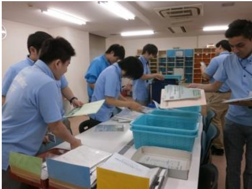
郵便物の仕分け業務