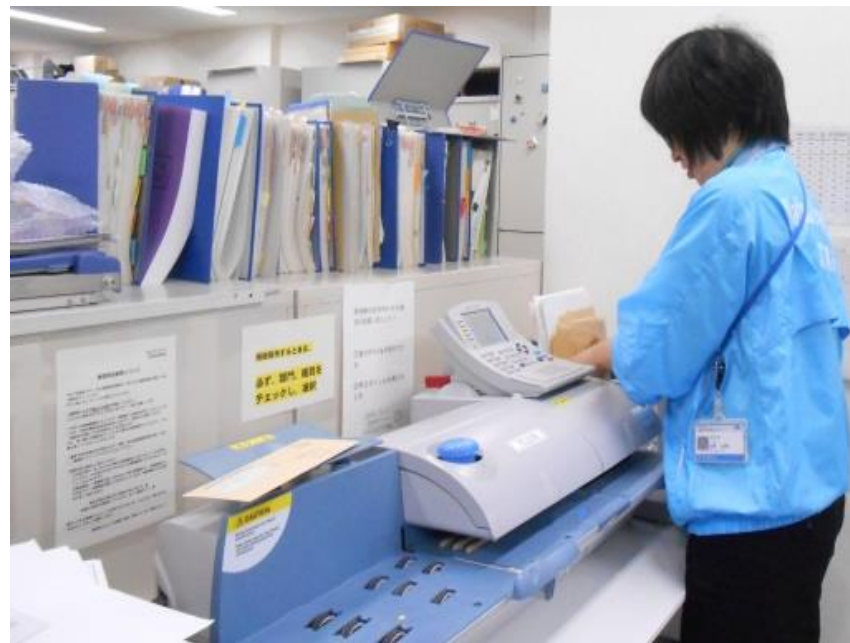
郵便物の発送業務