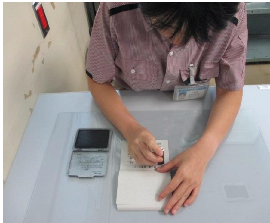
部署印の押印業務