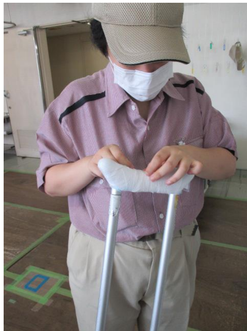
(松葉杖の包帯巻き)