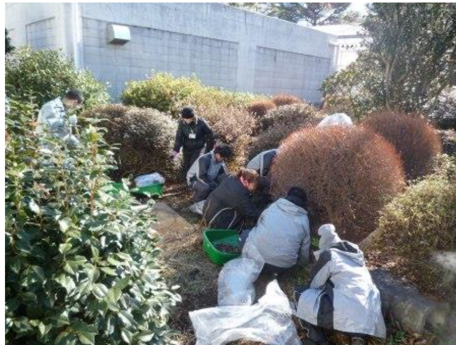
病院敷地内の植栽の手入れ