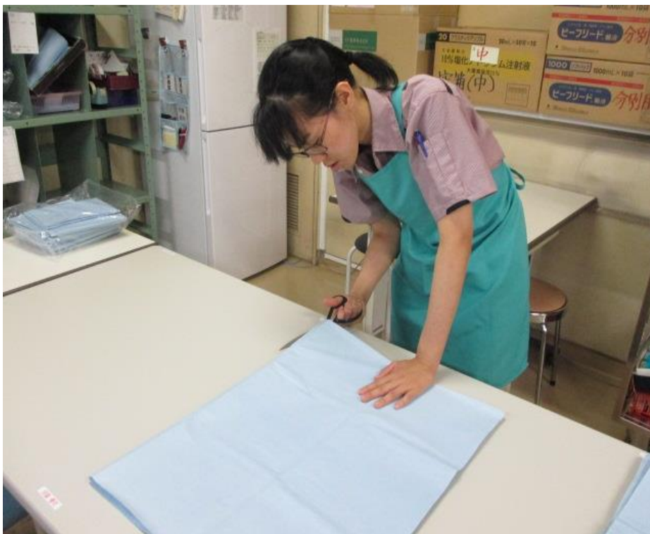
手術用シーツのカット業務