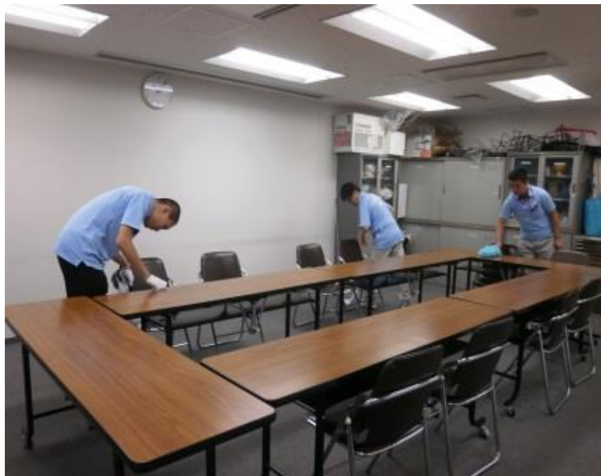
会議室の設営と清掃業務