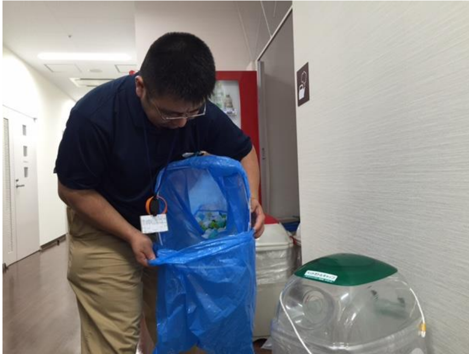
ペットボトル蓋の回収