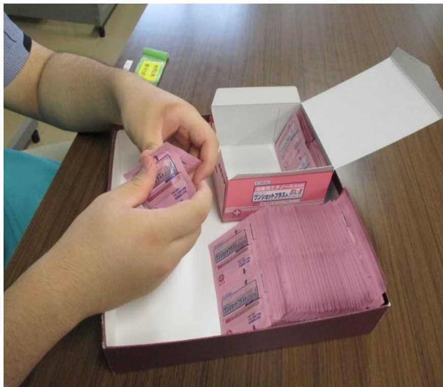
パックの切り離し業務