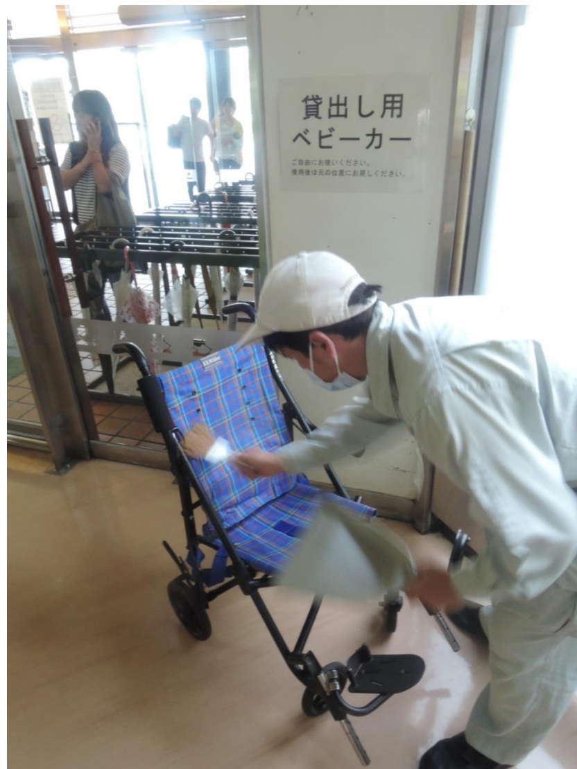
ベビーカーの清掃業務