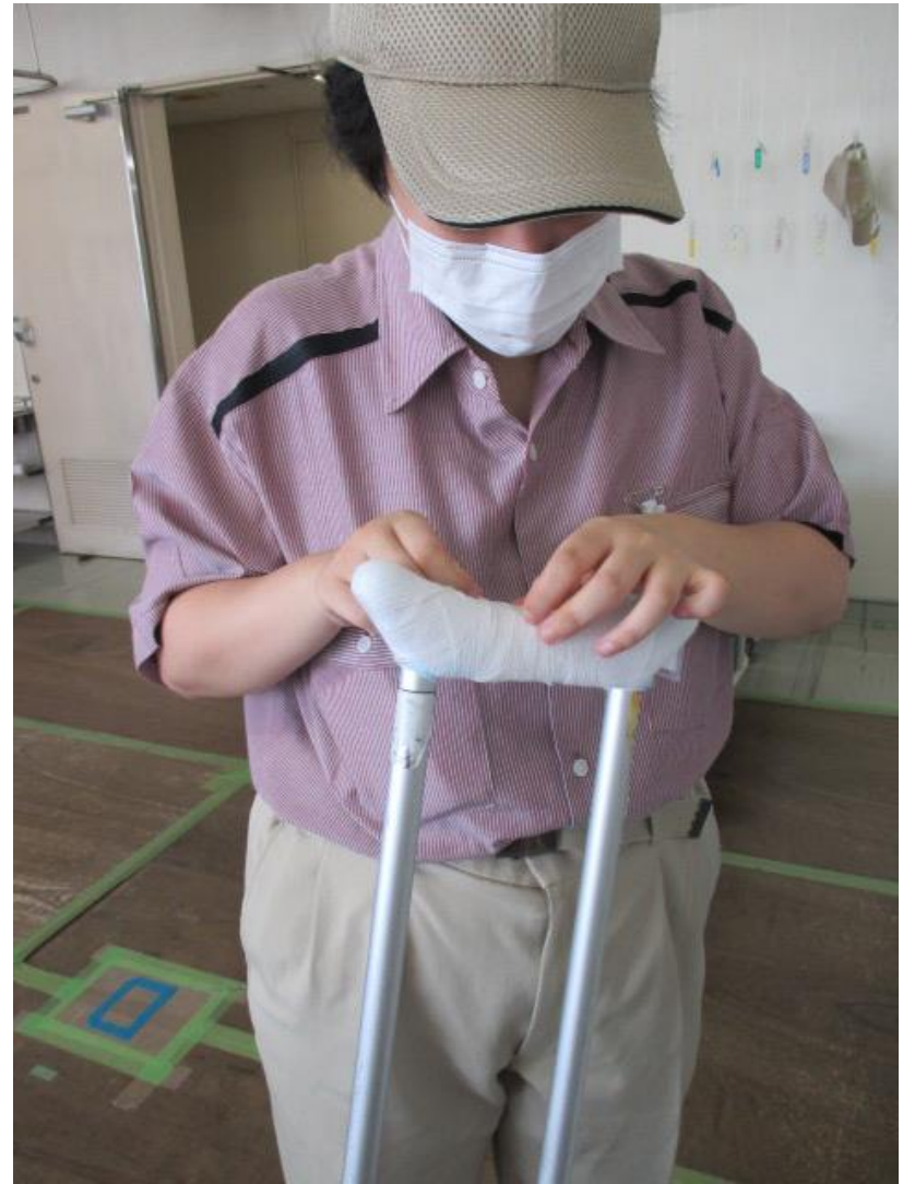
(松葉杖の包帯巻き)