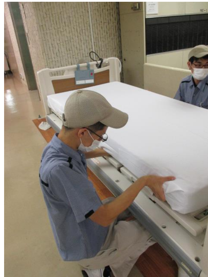
ベッドメイク業務