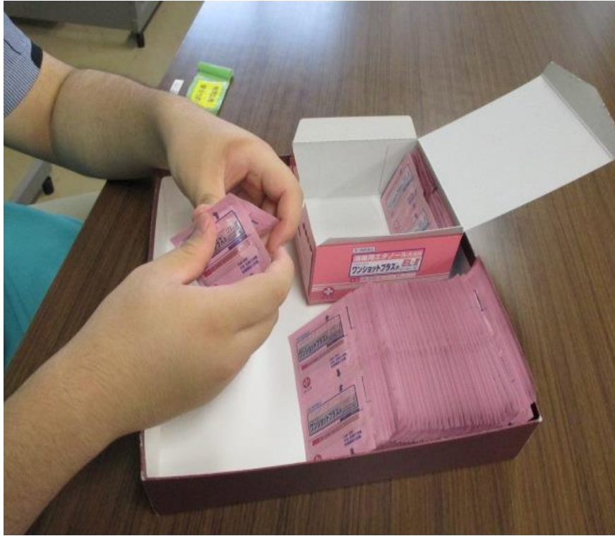
パックの切り離し業務