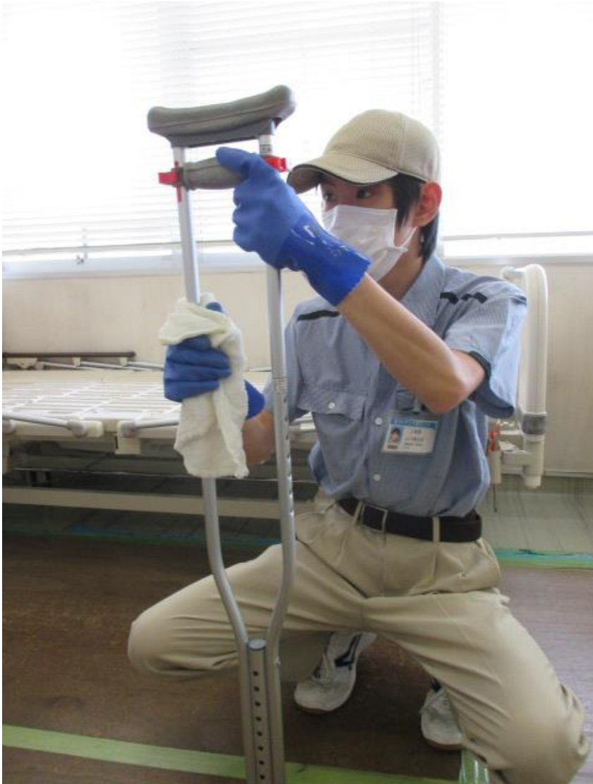
松葉杖の清掃業務