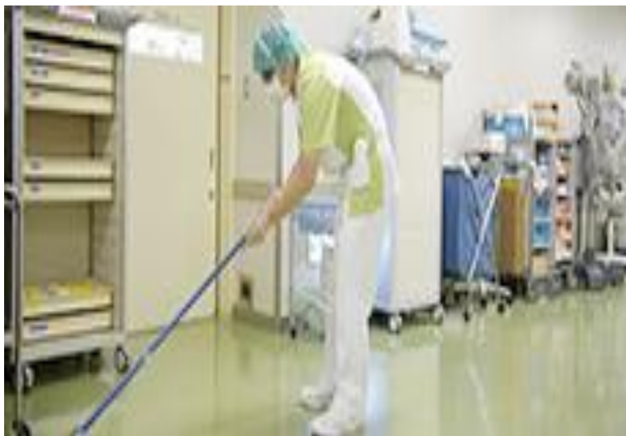
手術室の清掃業務