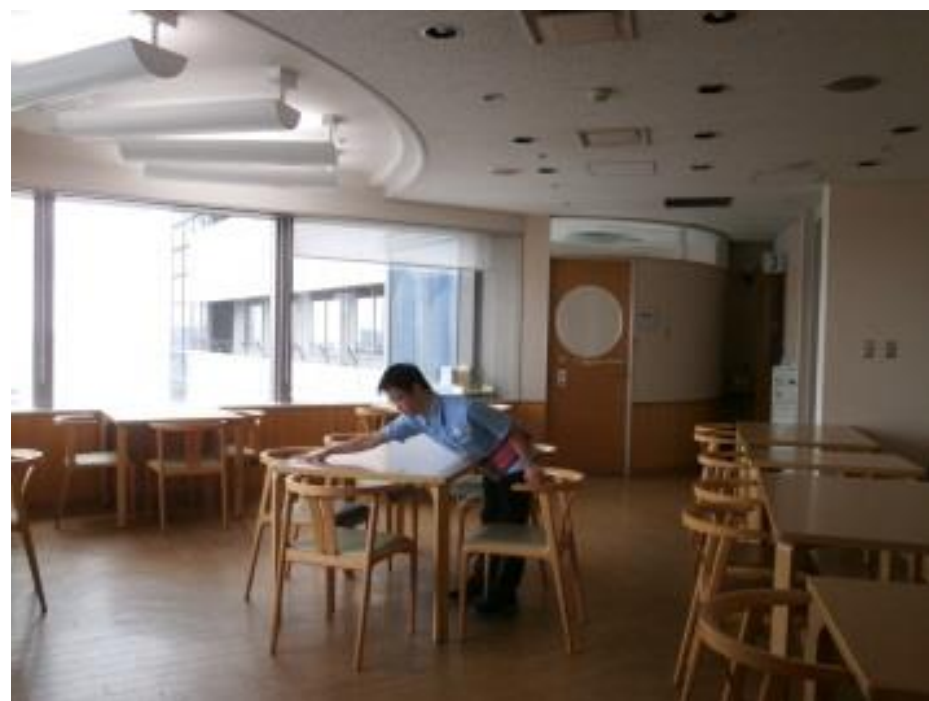
ラウンジの清掃業務