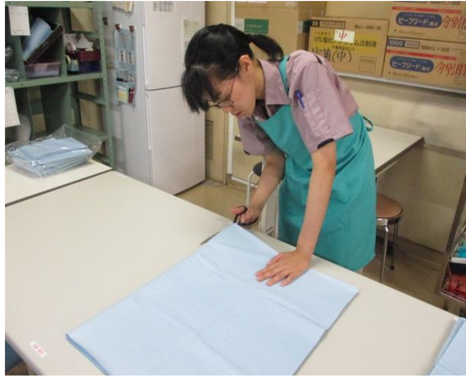
手術用シーツのカット業務