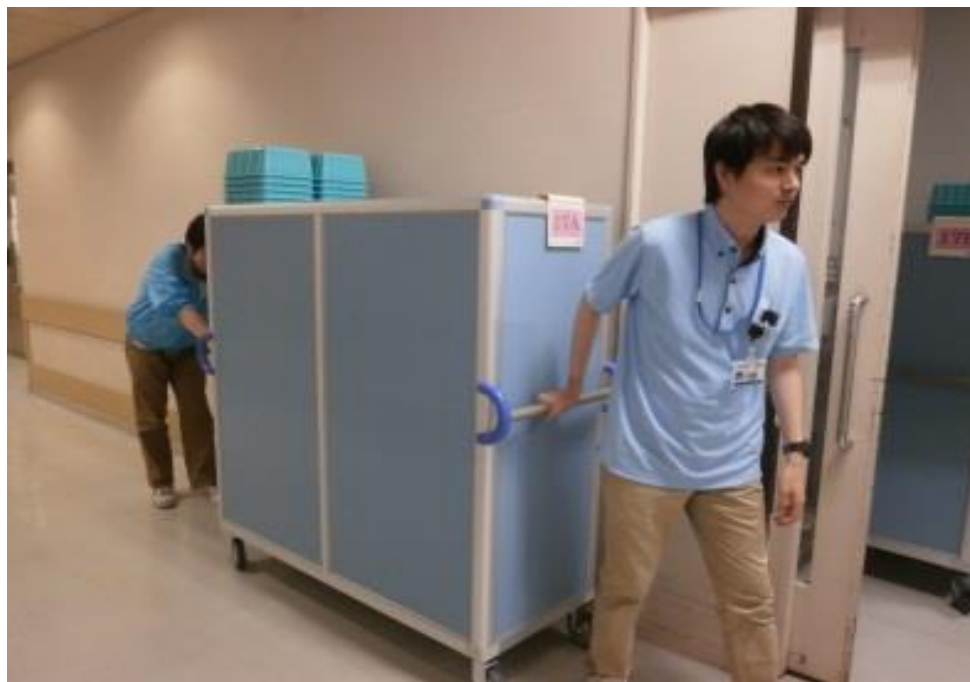
薬剤カートの搬送業務