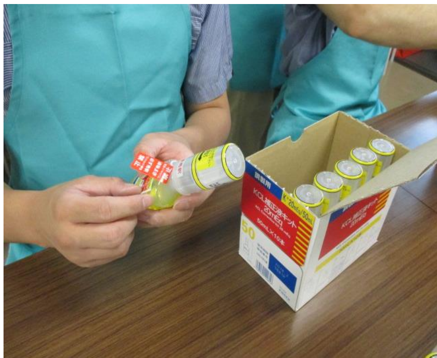
薬品への注意事項シール貼り業務